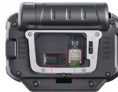
Micro SD/TF slot Micro SIM slot